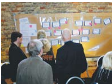
4. Man väljer vilken grupp man vill vara med i...

kuterades i grupper under eftermiddagen – ämnesområdena finns angivna i rutan här intill.