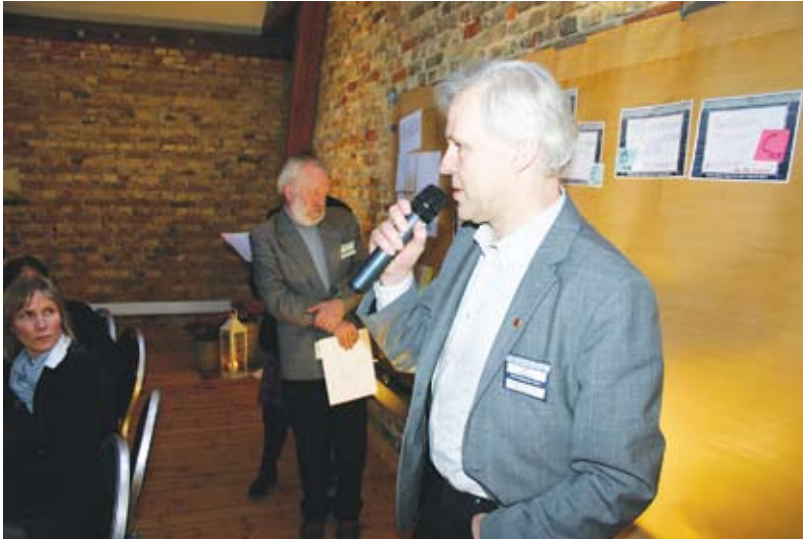
3. Gruppledarna gör en kort presentation av sitt ämne.