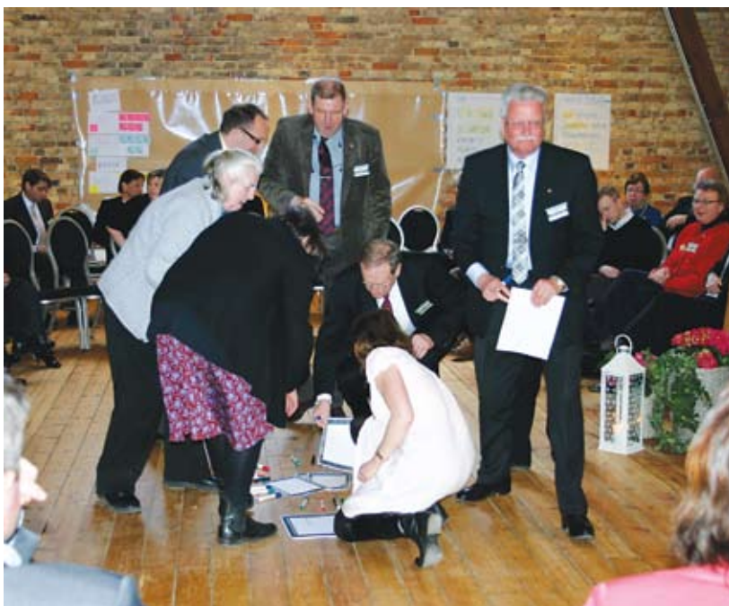
2. De deltagare som så vill tar en lapp, skriver upp sitt ämne och sätter upp lappen på anslagstavlan.

Eftermiddagen på Södertörns Rådslag 2009 ägnades åt arbete enligt den s.k. Open Space-metoden. Det innebär att deltagarna själva sätter agendan – de bestämmer ämnen, vilken grupp de ska delta i och hur länge.