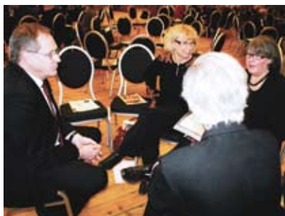
6. ... eller en liten.

man har, och i stället gå till en annan grupp. Slutligen anslås samtliga rapporter från grupperna på väggen, och alla kan ta del av vad som har sagts i de olika grupperna.