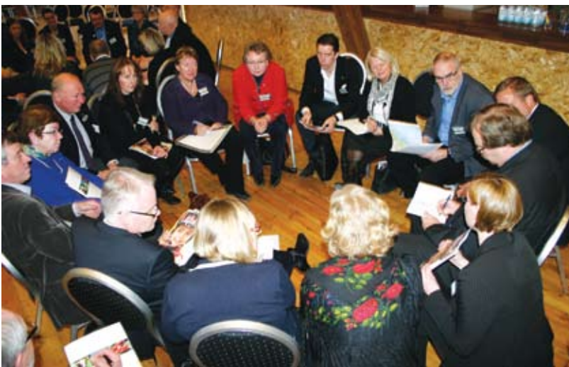
5. ... och diskuterar det i en stor grupp...

Deltagarna har full frihet att välja grupp och röra sig mellan grupperna – man kan lämna en grupp om man upptäcker att den inte riktigt stämde med det intresse