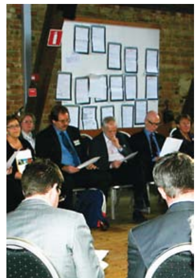
7. Slutligen hamnar alla rapporter från gruppdiskussionerna på väggen för alla att studera.